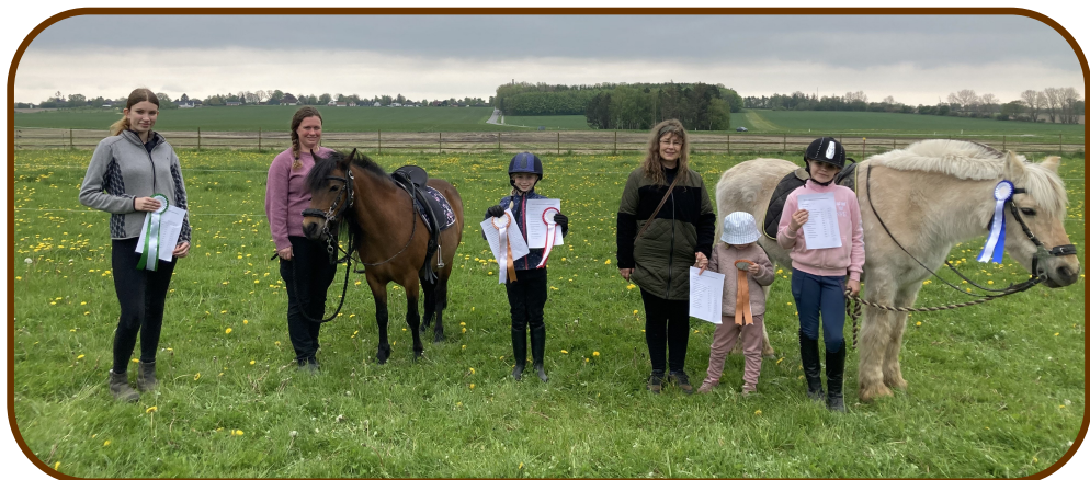
Rideklasse med trækker.