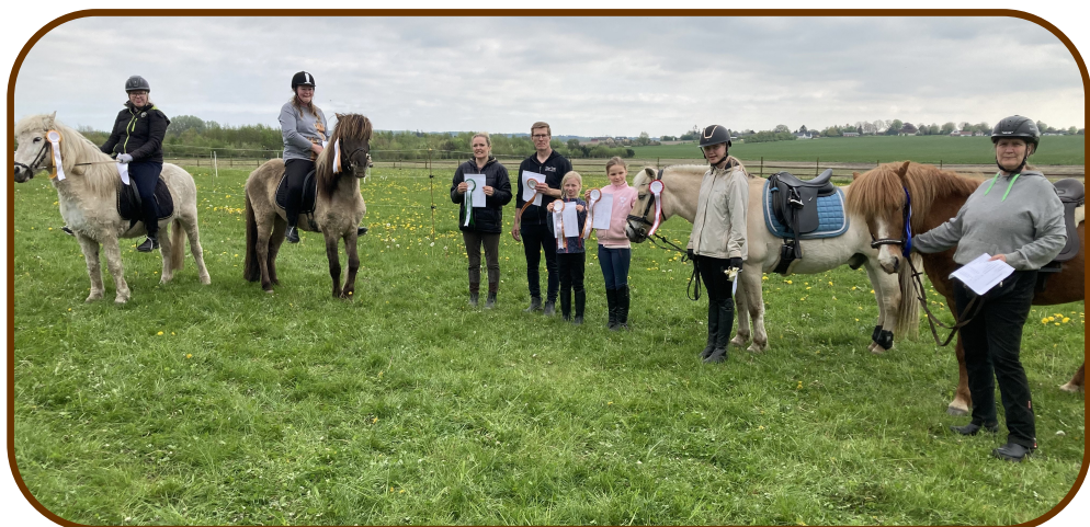
Rideklasse.