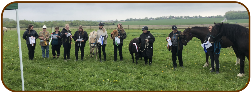
Trækkerklasse middel.

Desværre mangler vi et samlet billede af alle deltagerne fra trækkerklassen let.